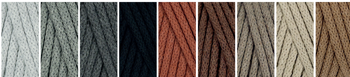
2228 Silver Grey